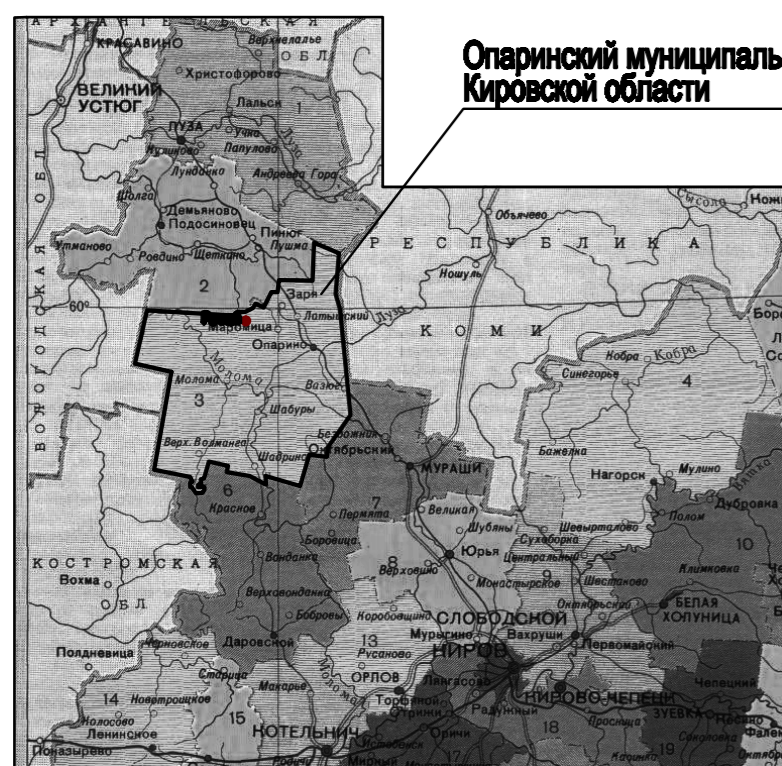
Опаринский муниципальный район Кировской области